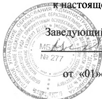
ГРАФИК РАБОТЫ КОНСУЛЬТАЦИОННОГО ЦЕНТРА